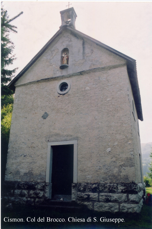
Cison. Col del Brocco. Chiesa di S. Giuseppe.